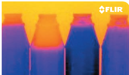
不透明ボトルの液量を検出

複数台のカメラが必要な場合や立体画像を撮影する場合、1台をマスター、他をスレーブに設定して同期することが可能です。